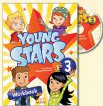
Workbook with Audio CD/CD-ROM