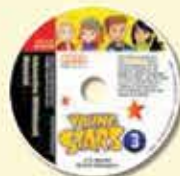
Interactive Whiteboard Material & Videos