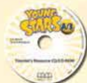
Teacher's Resource CD/CD-ROM