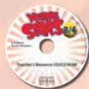
Teacher's Resource CD/CD-ROM