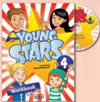
Workbook with Audio CD/CD-ROM