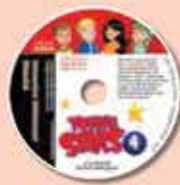
Interactive Whiteboard Material & Videos