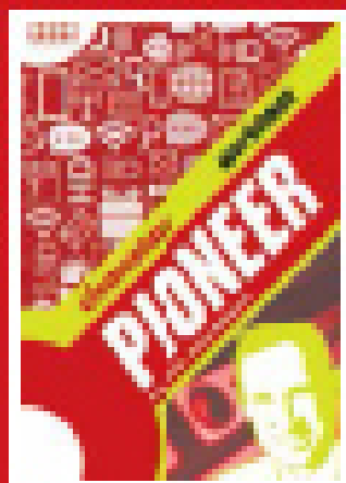
Full-colour Workbook (also available with key to check)