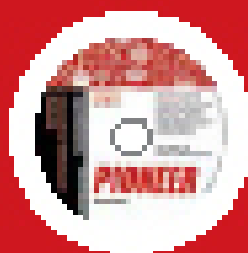
Interactive Workbook Material