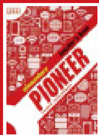
International Teacher's Book