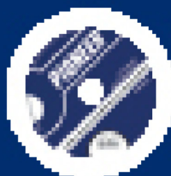
Teacher's Resource CD/CD-ROM with audio and video material