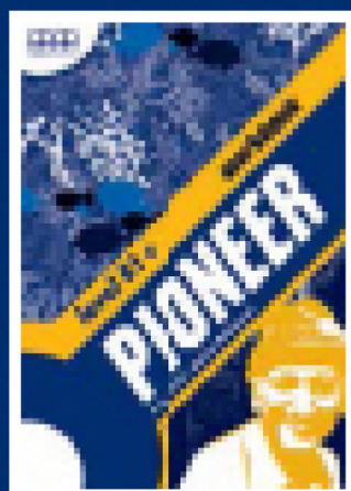
Full-colour Workbook (also available with key booklet)