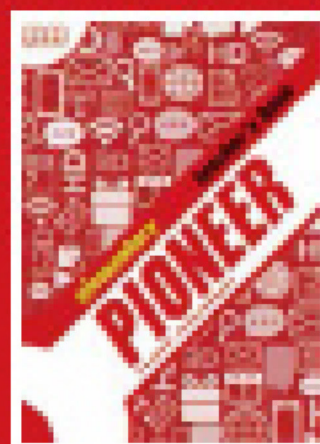
Interleaved Teacher's Book