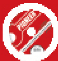
Teacher's Resource CD/CD-ROM with tests and extra material