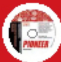
Interactive Whiteboard Material