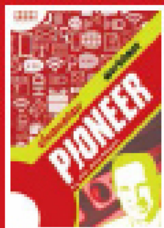
Full-colour Workbook (also available with key to check)